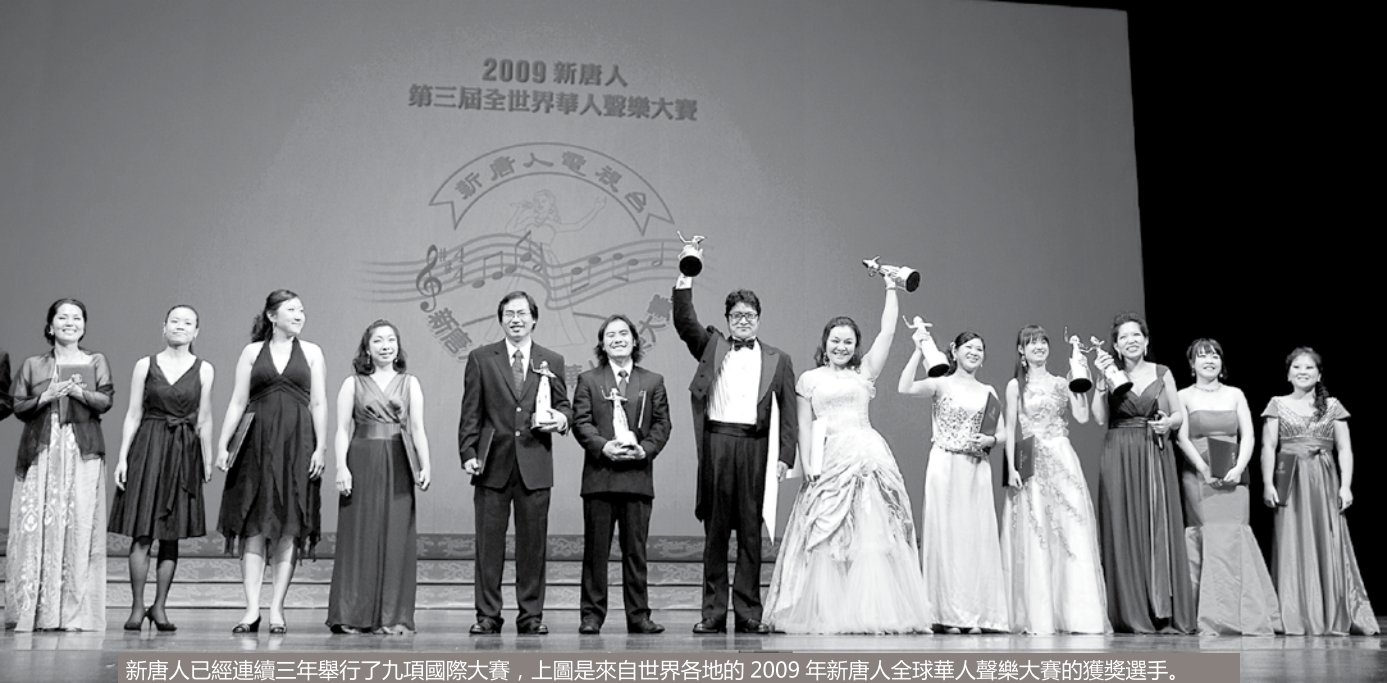
新唐人已經連續三年舉行了九項國際大賽，上圖是來自世界各地的 2009 年新唐人全球華人聲樂大賽的獲獎選手。