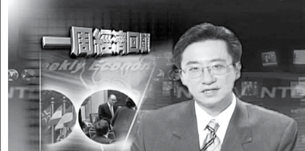
向東主持的“一周經濟回顧”已經成了許多華人每週必看的節目。