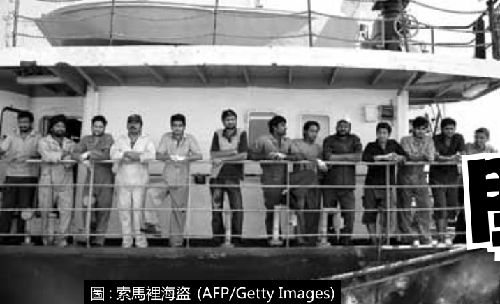
圖：索馬裡海盜