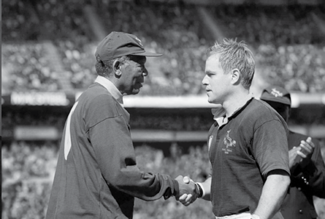
賽前，曼德拉穿上球衣親自到場加油，與隊長握手。