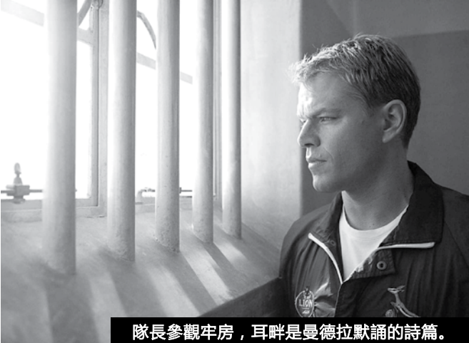
隊長參觀牢房，耳畔是曼德拉默誦的詩篇。