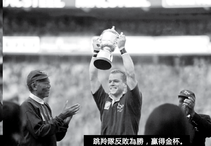
跳羚隊反敗為勝，贏得金杯。

風霜的曼德拉，德高望重，卻又非常樸實平易，身教重於言教，那種自然流露的慈愛，盡在無言中。他請隊長到總統府喝茶，誠懇談心。“告訴我，怎樣毫無保留的激發我們最大的潛能？怎樣激勵身邊的每個人？”曼德拉把能夠激勵他人成為更好的人，作為畢生天職。