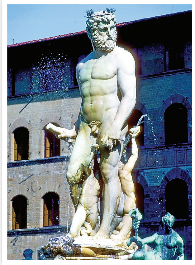
佛羅倫斯（Firenze）街頭的雕像，凸顯出文藝復興時代的風格（Piazza della Signoria）。

香之墓，還可比較提香墓碑後的大理石聖母昇天圖，與祭壇上面所畫的聖母昇天圖原作有何異同。