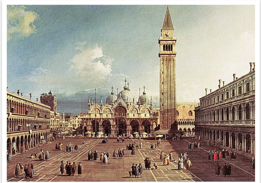
↑ 威尼斯的標誌聖馬可廣場