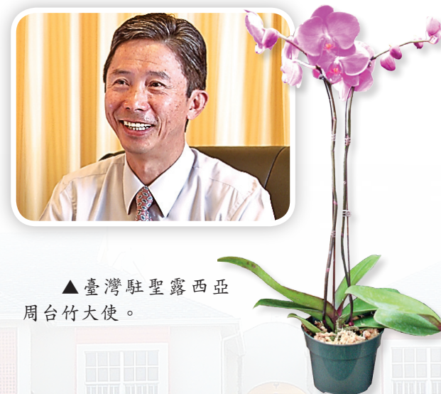
▲ 臺灣駐聖露西亞周台竹大使。

臺灣援建的大型蘭花溫室 Orchid Greenhouse 研發多種新奇美麗新花款 (50 多種)，係加勒比海地區最大的，可培育 70,000 株蘭花。周大使台竹先生歡迎來聖露西亞島的遊客們來參觀這獨特的蘭花溫室及種植各式各樣在美國及加勒比海難得一見的亞洲蔬菜農園。