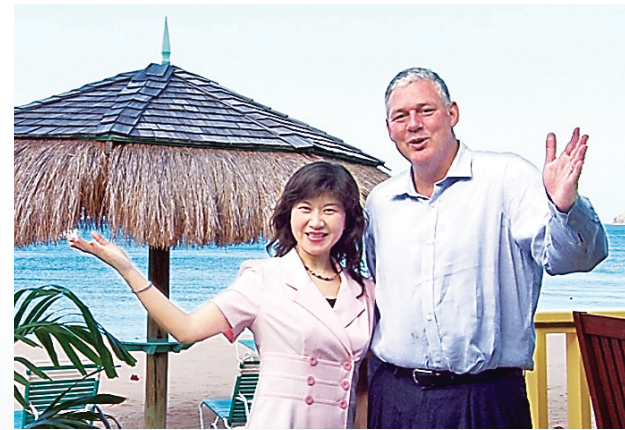
▲ 聖露西亞旅遊局局長艾倫·切斯特利

聖露西亞參議員亦旅遊局局長艾倫·切斯特利 (Senator the Hon. Allen M. Chastanet) 歡迎美國華人遊客來體驗美麗的聖露西亞島和位於 Reduit Beach 世界最聞名的十大海灘之一的海灣花園渡假村。