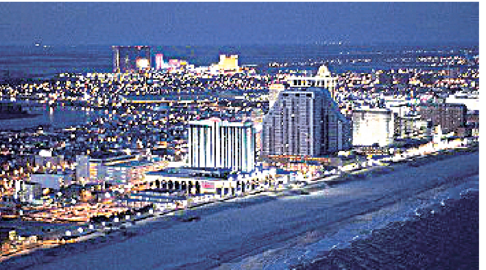
大西洋城 (Atlantic City)

具有悠久的歷史文化、獨特的地理環境、豐富的娛樂活動的新澤西，有數不盡的旅游景點和購物中心，縱貫南北，橫跨東西，還有孩子們喜歡各種游樂場和動物園，是旅遊度假的好去處。