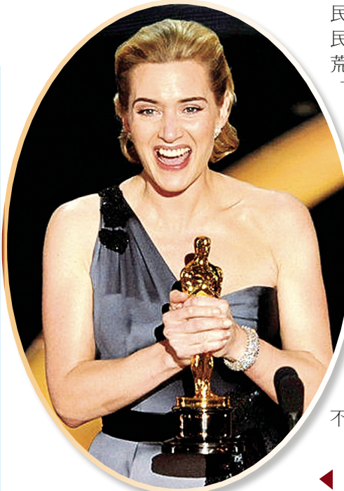
奧斯卡影后凱特·溫斯萊

我不知道《大腕》們的《集結號》能夠糾集起多少血腥憤青的狂熱，但是我知道，印度人你且歇歇吧，應該回家沒事偷著樂才對。比起那些不能說真話的人來說，你們的確是貧民的富翁。這世間真正的丑行不是對邪惡的揭發而是對邪惡的掩蓋。所以非誠勿擾！