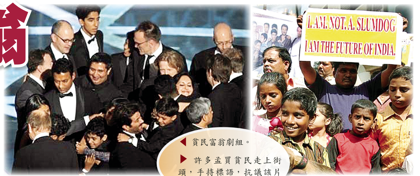
貧民富翁劇組。 許多孟買貧民走上街頭，手持標語，抗議該片醜化了印度貧民形象。

與印度毗鄰的喜馬拉雅山北面，有一個同樣發展中的大國。幾年來一直躍躍欲試想要開鼎奧斯卡。且看他們製作的幾部大片《滿城盡帶黃金甲》與《夜宴》。一面外強中干的塑造大國的磅礴氣度，一面上演亂倫宮廷的明爭暗鬥。誰能說這不是當代中國的真實寫照呢？