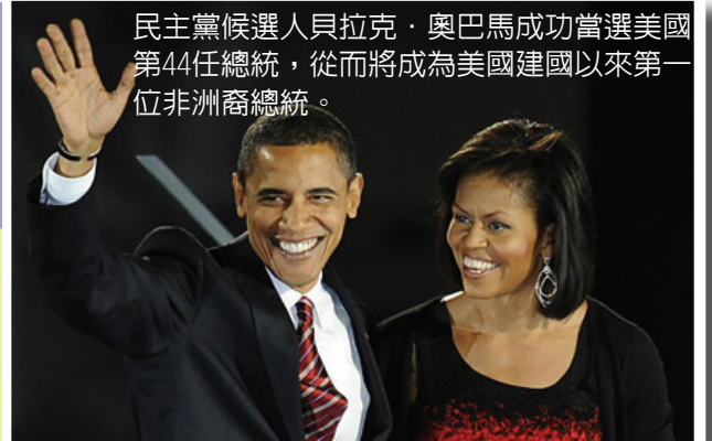
民主黨候選人員拉克·奧巴馬成功當選美國第44任總統，從而將成為美國建國以來第一位非洲裔總統。