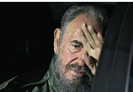
卡斯特羅即將謝幕

從今年9月份開始，人們往往把「中國製造」與廉價低劣的產品掛鉤，原因是近幾個月來很多出口到美國和歐洲的中國產品因連續出現安全問題而被查禁。