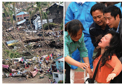
緬甸颶風與四川地震造成人間慘劇

英格麗貝坦古特從曾是國家的總統候選人。被毒梟一馬克思主義者的哥倫比亞革命武裝力量俘獲三年。哥倫比亞安全部隊採用了大膽的偽裝，將貝坦古特救出。