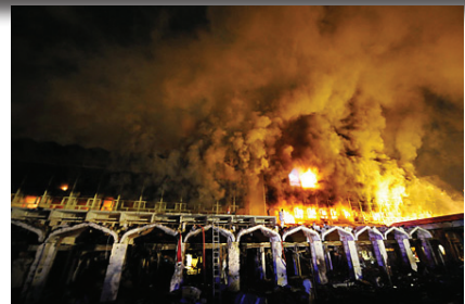
巴基斯坦恐怖主義盛行。首都的飯店被炸毀

11月26日，印度孟買發生恐怖襲擊事件，造成至少174人死亡、數百人受傷。今年以來，此類恐怖襲擊事件在各地連連上演。