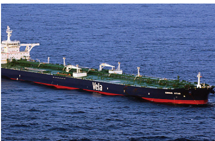
東非海盜出沒劫持油輪

9月21日，巴基斯坦首都伊斯蘭堡的萬豪酒店遭自殺式爆炸襲擊，造成300多人死傷。在伊拉克、阿富汗恐怖襲擊使當地民眾依舊苦難深重。