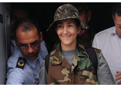
哥倫比亞人質獲救

古巴前國務委員會主席和部長會議主席，古巴共產黨第一書記。2008年2月19日公開表示不會再尋求擔任古巴國務委員會主席職務。