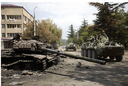
俄羅斯兵犯格魯吉亞

今年共有近70艘商船在索馬里附近海域遭到劫持，聯合國安理會通過3份打擊索馬里海盜的決議，授權外國軍隊經索馬里政府同意後可進入其領海打擊海盜。