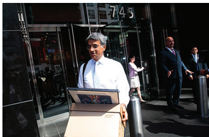
九月十三日雷曼兄弟破產，華爾街金融風暴開始。

以雷曼兄弟為代表的美国金融機構接連陷入困境，引發了自1929年以來全球最嚴重的金融危機，並導致全球範圍內的經濟增長減速。