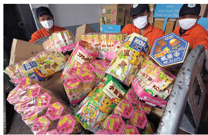
「中國製造」在世界引起食品安全恐慌

今年8月8日，北京奧運開幕的同一天，俄軍一支裝甲部隊進入茨欣瓦利地區，正式入侵格魯吉亞。